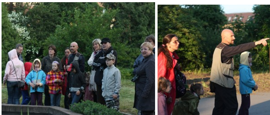
На экскурсии «Голоса птиц» в Ботаническом саду МГУ.

Увлекательное и интересное занятие слушать голоса птиц, узнавать птиц по голосу, подражать птичьим трелям.