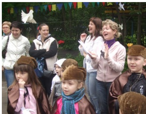
Праздник «День Птиц» в детском саду